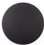
grille noire (option)